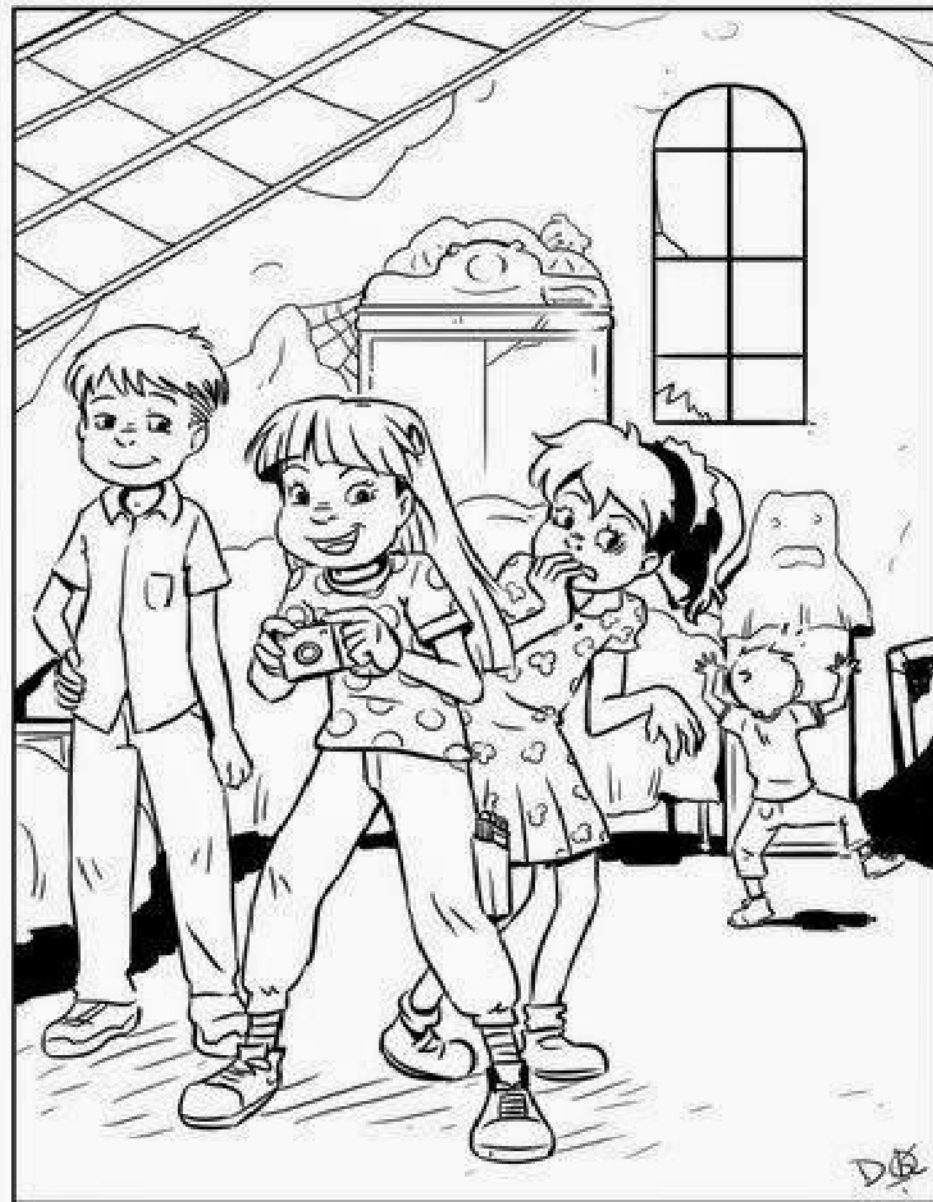
Exercicio 4: Busca 9 diferencias