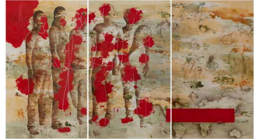
Illusions , 2020 Tècnica mixta sobre tela 190 x 330 cm