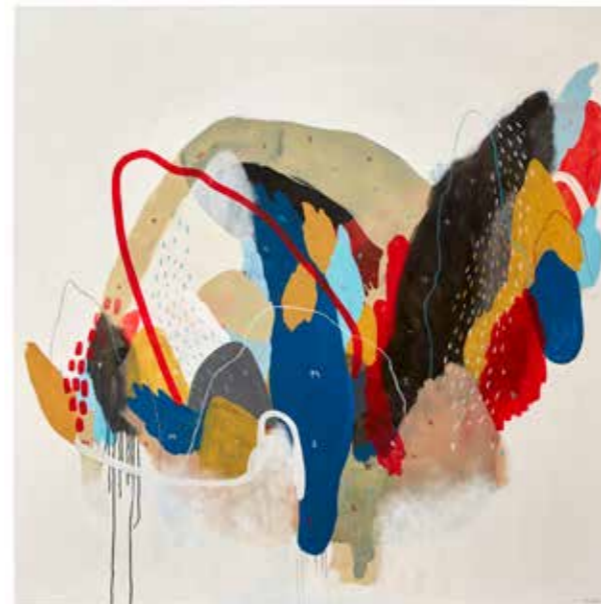
Horizons from home, 2020 Série Migrations Mixta 180 x 180 cm