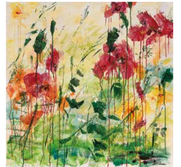
"Nature & color for life I", 2020 Mixta, collage i acrílic damunt llenç 100 x 100 cm