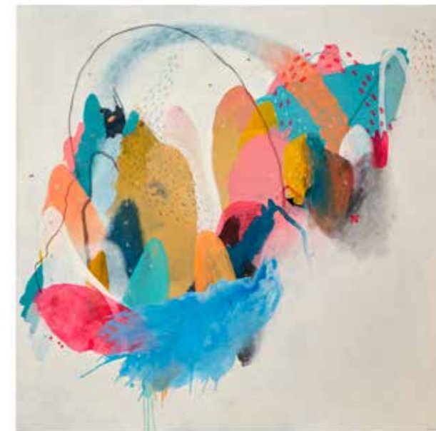
Horizons from home, 2020 Série Migrations Mixta 180 x 180 cm