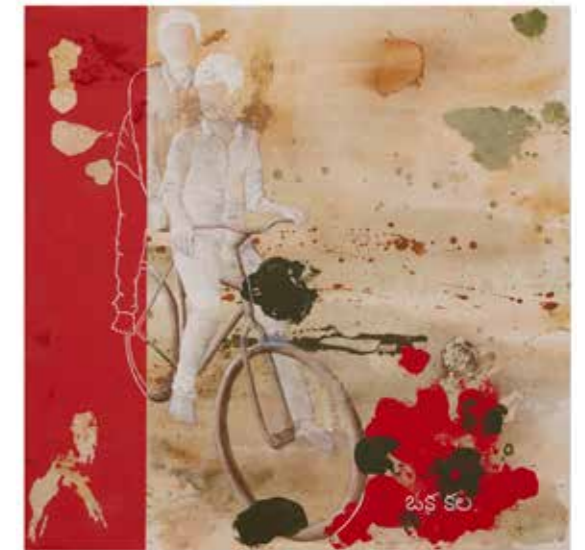
Oka kala , 2020 Tècnica mixta sobre tela 100 x 100 cm