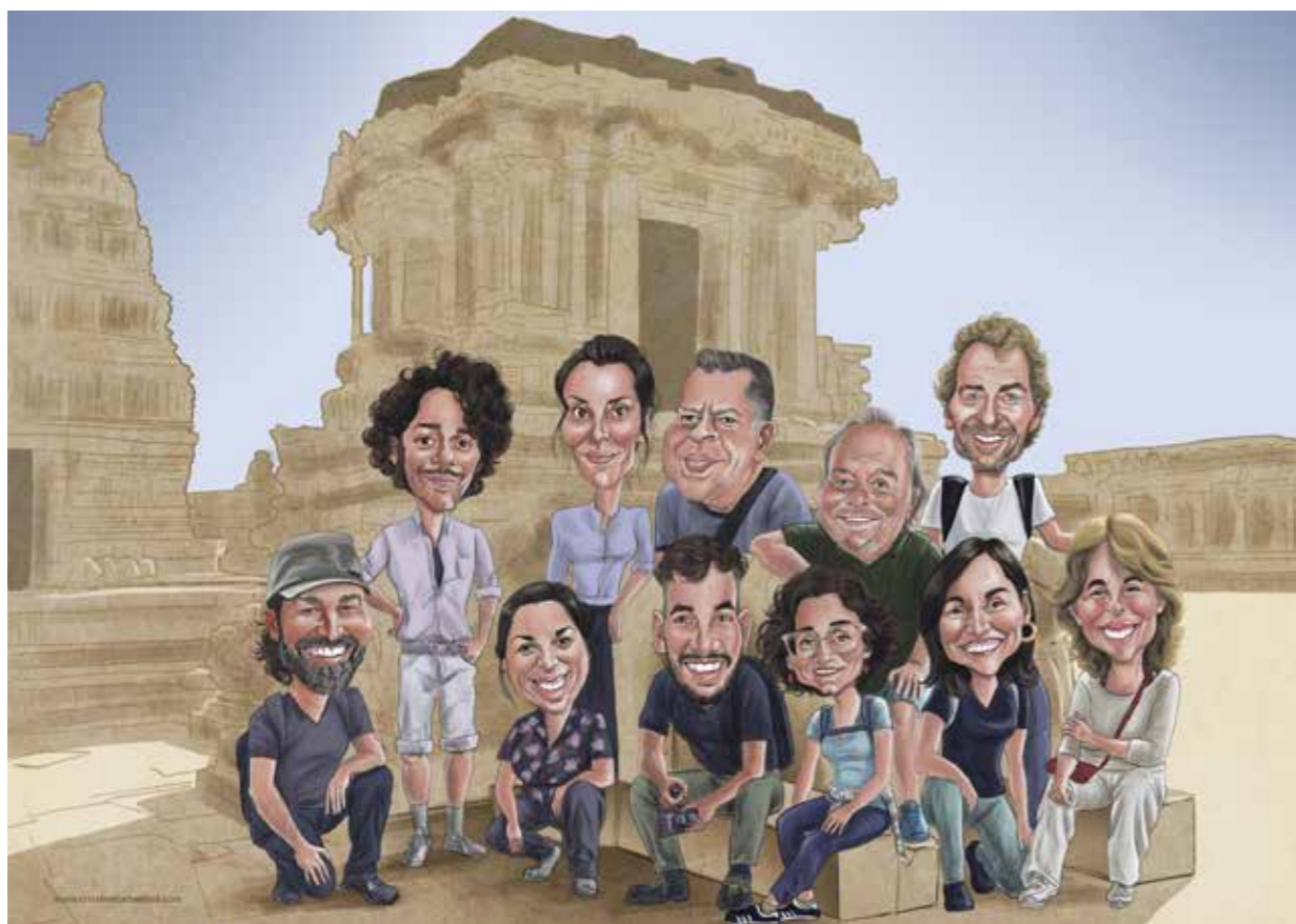
Cristina Torbellina Il·lustració en Photoshop