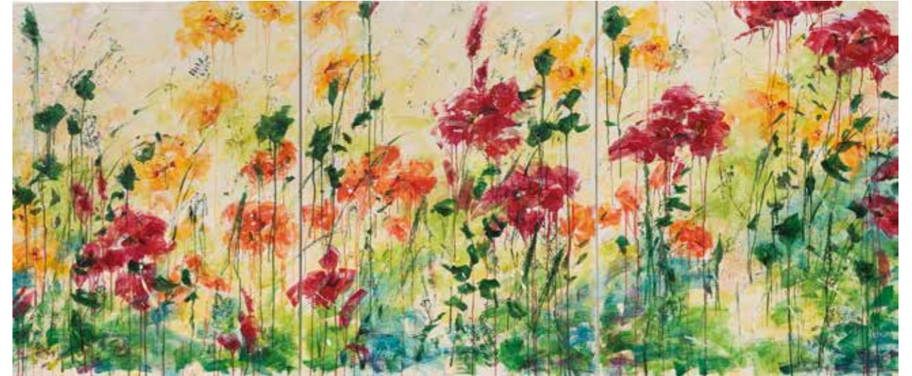
"Nature & color for life I", 2020 Mixta, collage i acrílic damunt llenç 146 x 114 cm. Triptic. (x3)