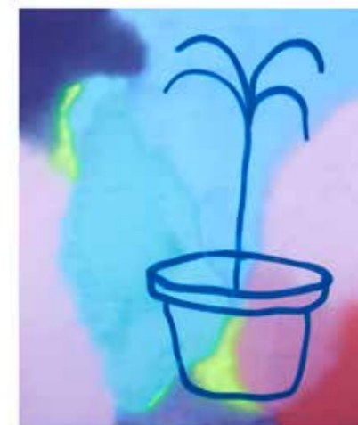
19, 2020 Série: New Avant-garde Esprai sobre tela 100 x 81 cm