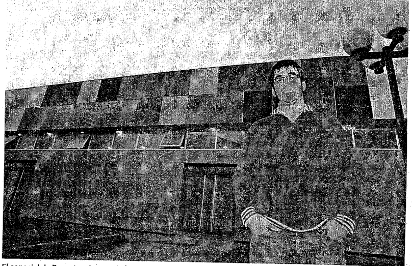
El concejal de Deportes destaca la mejora de las instalaciones y los servicios deportivos

Cualquiera de los nuevos despachos son más grandes que todo el local de la calle Coruña. Los usuarios se encontrarán con un mostrador de atención al público amplio y moderno, y con un equipamiento en el que se combinan los colores blanco y negro. En la pared lateral de la izquierda destaca un papel con fondo gris repleto de caricaturas, diseñado por Javier Maris-