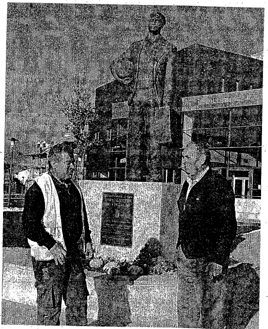
El alcalde y un operario hablan sobre los últimos retoques | CASAL

El proyecto quedó desierto en la primera licitación por procedimiento negociado (invitando